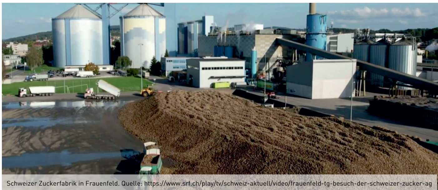
Schweizer Zuckerfabrik in Frauenfeld.